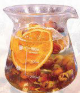
▲ 咖啡果皮與薑黃結合的創意茶飲-咖啡風味果乾薑黃茶 提升免疫力

薑黃是薑科植物薑黃的塊根，從食療上它是一種食品調味料的來源，也是咖哩粉主要原料之一。薑黃在中醫藥用的應用，性溫，味辛、苦、甘，歸脾、肝兩經，功效有行氣、通經止痛、芳香健胃等作用。薑黃含揮發油、薑黃素、阿拉伯糖、果糖、葡萄糖、脂肪油、澱粉等。近幾年來薑黃無論藥療與食療上，都被廣泛大力的推廣，而且把薑黃功用闡述淋漓盡致，唯每味藥都有其優缺點，用對是藥用錯是毒。(文/康金龍老師)