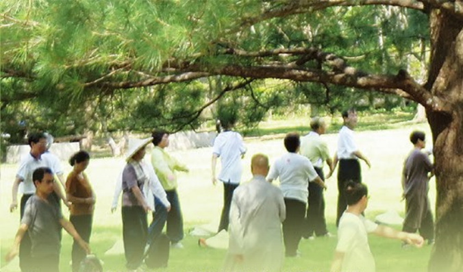
▲花蓮自然環境優美，經常舉辦禪修活動，吸引了許多民眾。

地 處偏遠、民風淳樸的東臺灣，擁有倚山面海的天然環境，花蓮辦事處就位於這塊好山好水的淨土當中。