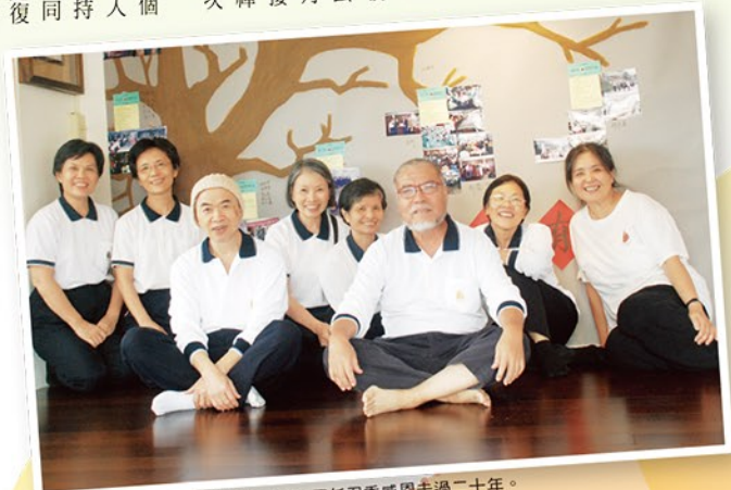
▲在花蓮辦事處的「生命樹」前，歷任召委感恩走過二十年。

在當地推動佛法奠祭，是辦事處的重要大事。十多年前，花蓮民眾的輿論觀念仍很傳統，經過眾人努力，不僅禮儀公司了解依法鼓山理念辦理的佛事，在告別式會場，更常聽到民眾回應：「我以後也要這樣辦理。」或問：「要什麼資格才能這樣辦？」以莊嚴佛事祝