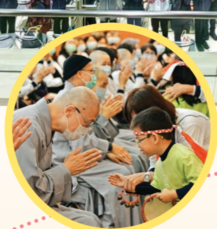
▲紫雲寺·小菩薩與法師互動。(紫雲寺提供)