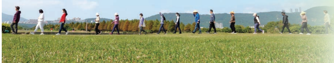
▲來到人生中年，跟著佛法引領，展開另一場身與心的修行。