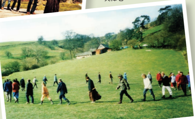
▶1989年，師父首度於英國威爾斯主持禪七，自此展開至歐、亞、北美洲指導禪修的弘化之行。圖為1992年威爾斯禪七。

備三個條件：首先是對佛法要有正確的知見，其次是穩定的情緒和品德，第三是有慈悲度、弘法利生的菩提心。我非常重視師父的教導，因此將一生都奉獻於弘揚佛法、協助法鼓山的發展。例如，撰寫書籍、文章，透過網路舉辦禪修講座，讓世界各地的學生都能參加，與在家眾以及出家眾分享佛法，和僧團