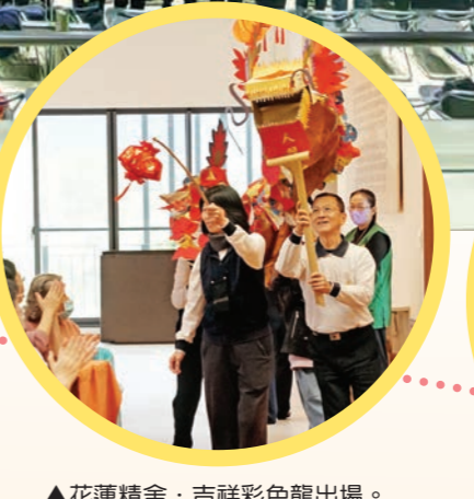
▲花蓮精舍·吉祥彩色龍出場。