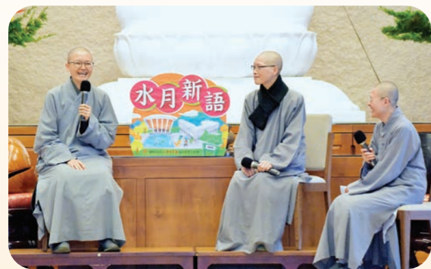
▲農禪寺·法師分享農禪生活。