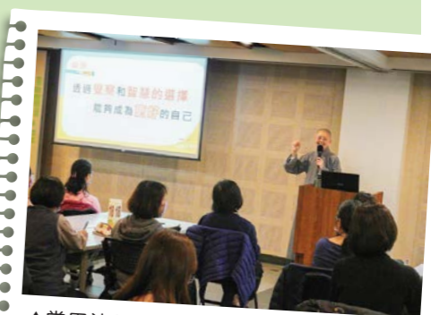
▲常用法師期勉學員透過覺察和智慧的選擇，成為更好的自己。