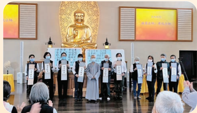
▲信行寺·感恩各組悅眾。