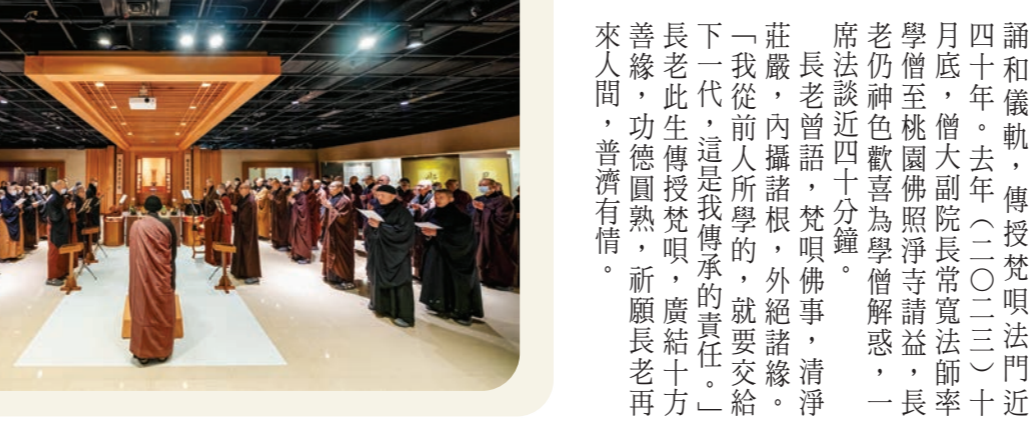
▲僧團辭歲禮祖，同願萬行。(李東陽攝)

一月二十四日，全臺各地近三百位僧眾回到本山，在方丈和尚果暉法師的帶領下，於開山紀念館辭歲、禮祖，並聆聽創辦人聖嚴師父的開示，接著隨方丈和尚發願，為來年作好「心」的準備，繼續推動一「提昇人品，建設淨土」的大願。 時值歲末，聖嚴師父的影音開示中特別提醒，過年圍爐的精神，在於檢討過去這一年自己的道心有沒有成長？團體有沒有進步，對於社會有沒有貢獻？面對新的一年，師父勉勵大眾，新年是重新開始的時候，個人的成長之外，還要配合著團體的腳步一起向前，時時對未來抱持危機感，回應全球的脈動與需求，才能真正對社會有所貢獻。 方丈和尚開懷時，提出「三隨安身心」——隨時安身、隨處安心、隨身安心，鼓勵僧眾善用方法，保持身心的健康、平和，自己安住了，就有力量幫助更多的人。(文／釋演穩，圖／李東陽)