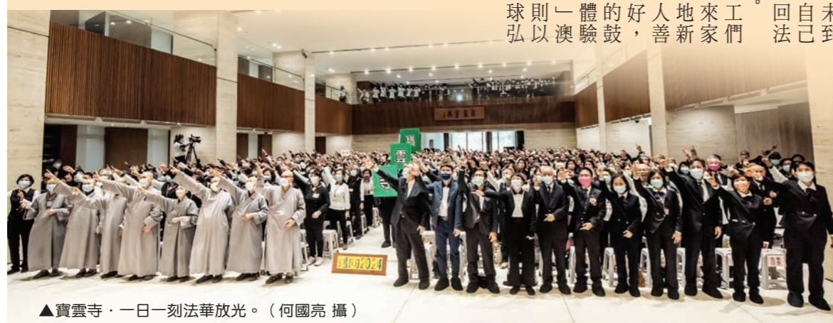
▲寶雲寺·一日一刻法華放光。