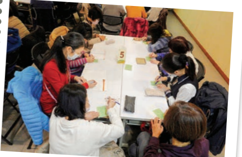
▲學員們一起思考，寫下想要變得更好的人、事、物。

步 入中年，身心、工作、家庭都來到一個不同階段。身體明顯變化，可能需戴老花眼鏡才能看清楚；心理上，需獨立判斷的情況愈來愈多；職場中，面臨後輩的挑戰；家庭中，常是「上有高堂父母，下有嗷嗷待哺」。如何讓中年人生活得更好？一月六日，農禪寺「後四十的人生必修課」以「成為更好的自己」為主題，由信眾教育院院長常用法師引導一百三十位學員，從傾聽自己、向內探索出發，步上更好的中年人生。