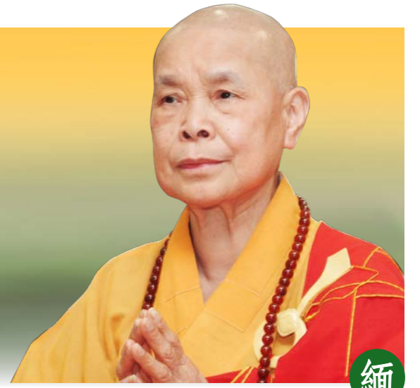
緬懷二師伯鑑心長老尼