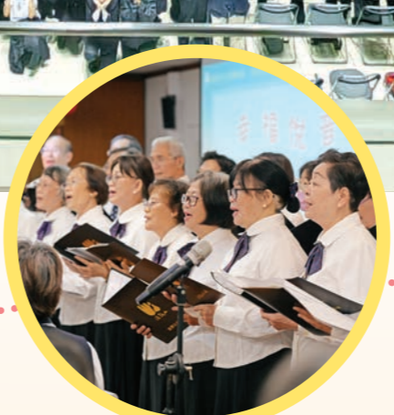
▲臺南分會·合唱團獻唱幸福福音。