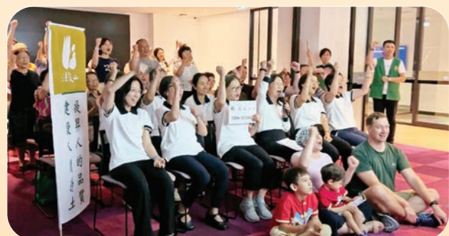
▲雪梨分會·視訊齊聲歡呼。