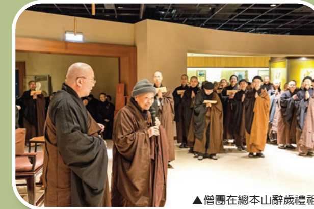
▲僧團在總本山辭歲禮祖

東初老人創辦中華佛教文化館後，二師伯鑑心長老尼（右）與大師伯錠心法師即來到文化館協助。此外，兩位法師也隨東初老人（左）協助農禪寺周邊田裡的出坡作務。