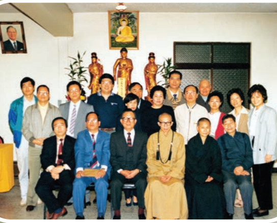
▲佛研所護法理事會