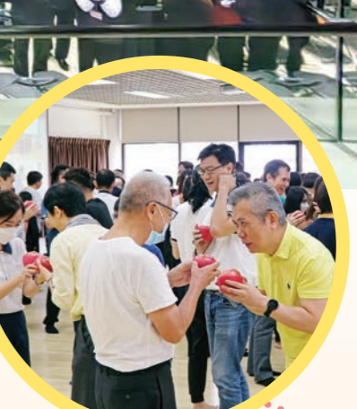
▲新加坡護法會·交換供果互道祝福。