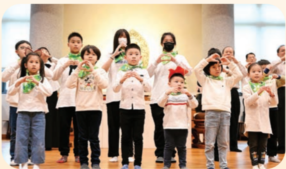
▲蘭陽分會·小菩薩感恩演出。