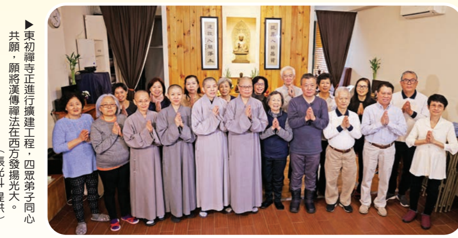
▲ 東初禪寺正進行擴建工程，四眾弟子同心共願，願將漢傳禪法在西方發揚光大。

《他的身影2》拍攝團隊於二〇二三年二月六日，與果元法師、演法法師一同搭機，由墨西哥飛往休士頓，再轉紐約。沒料到，迎接我們的是零下超低的溫度。