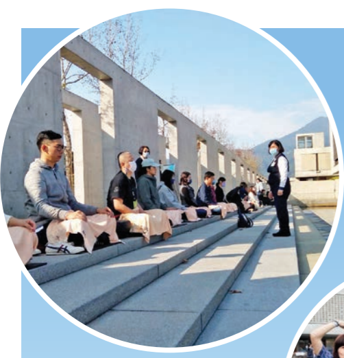
▲坐在水月池畔，尋禪而來的民眾靜下心，跟隨義工引導，體驗身心放鬆的感覺。

2012年底，聖嚴師父喻為「空中花，水中月」的水月道場落成，農禪寺從樸實的鐵皮建物群，蛻變成令人耳目一新的景觀道場，在喧囂的都會紅塵中，成為新一代信眾學佛修行的心靈家園。