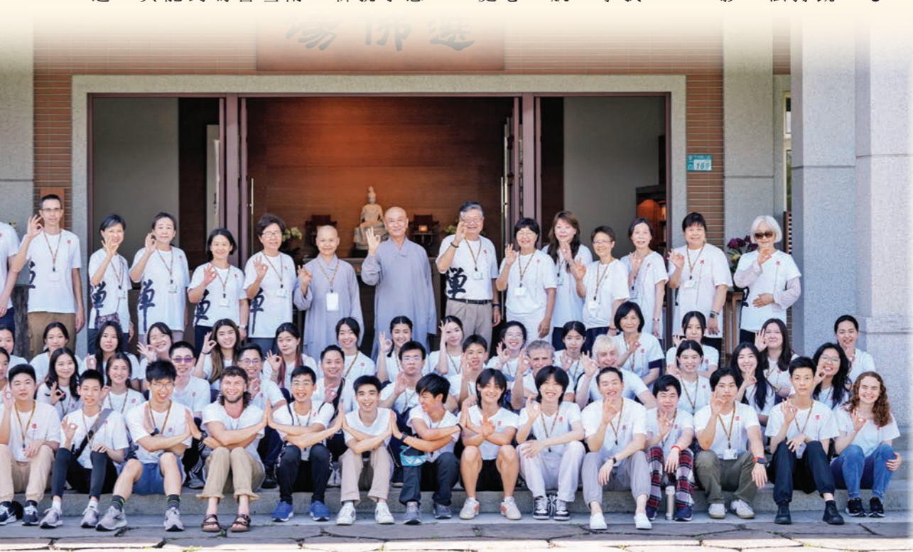
▲體驗第一天天南寺的寺院生活後，全體學員感謝大眾的照顧，歡喜合影。

用齋時，深深被安靜的氛圍所感動。在快節奏的現代生活中，我們很少有機會去享受食物的味道，或與他人一起用餐，通常只是無意識地吞嚥食物，沒有任何感受和體會。