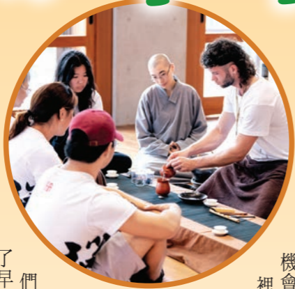
▶泡茶、倒茶、喝茶，每個動作都是禪的放鬆體驗。

我們總是習以為常地尋求舒適，因此，當既有的觀點和生活方式受到挑戰，很難保持開放的心去擁抱改變。來法鼓山之前，我無法預期會發生什麼，也不確定會得到什麼，然而，這趟旅行對於我的生命，確實產生了積極的影響。清晨的早課、禪坐，還有整個環境的平靜，打破了平日的生活狀態，走出了舒適圈。