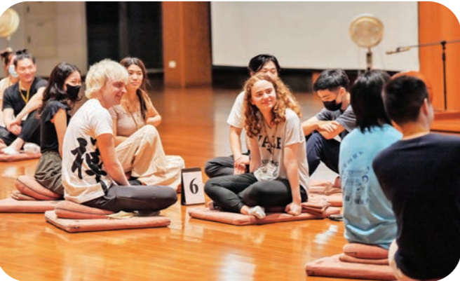
▲在天南寺禪堂裡，青年學子分組互動，分享彼此的感受和體驗。

人們常將寺院中的佛教，與現實生活中的佛教區隔開來，幾天下來，我發現這是不正確的。我希望拉近這樣的差距，學習將佛法應用在日常生活，這份決心，與我這次禪修的決心，一樣堅定。