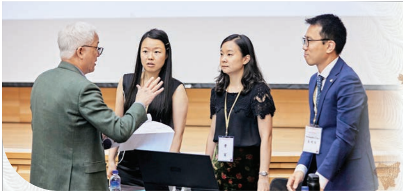
▲聖嚴思想研討會中，資深學者與青年學者齊聚互動交流，展現漢傳佛教學術研究的傳承與展望。

歷經疫情三年，能全程參與實際研討會，感受到在佛教學術研究上有許多新的局面，包括全新的研究領域、新的青年研究學者的出現，也有一些「借新舊文獻之探究」而發人省思之處。 佛法傳承與流布間 看見緣起法 研討會的專題演講，首先是衣川賢次教授演講的〈南宋臨濟禪初傳日本之研究——以蘭溪道隆為例〉，非常簡潔地道出了禪宗從一開始的出現，到南宋禪宗的成，都是一場禪法在「世俗化」與「聖典化」之間，此消彼長的歷程。衣川教授透過「整體的國家社會文化發展概況」、「宗教社會學」式的研究切入點，是非常值得學習與思考的新視角與論述方向。 陳玉女教授的〈從《嘉興藏》的海內外流通再思考明清佛教的歷史地位〉，闡述了有關《嘉興藏》真可禪師能結合民間力量，完成一部《大藏經》的結集極為艱難。數十年如一日的結集，歷經艱辛的刊刻、保存與流傳的過程，讓人極為動容與感佩。 二場演講所探討的主題，時空環境非常不同，卻同樣展現了佛法在城鄉之間、在社會菁英與平民百姓之間、在聖典化與普及化之間，不斷地在往返擺盪與尋求平衡的演變歷程。這樣的歷程從古至今，一直都在流動變化，令人深刻體會到此生故彼生，此滅故彼滅，諸法生滅不已，緣起法的真實義。 其他論文的發表，可看出佛法與禪修的研究，有走向世俗化、現代化、全球