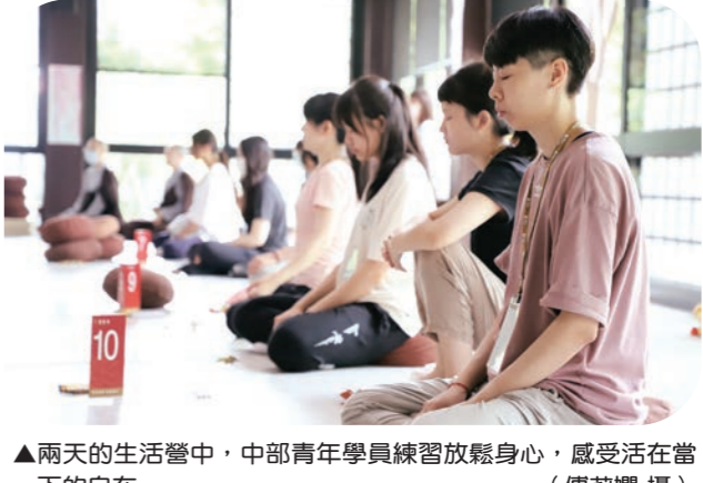
▲兩天的生活營中，中部青年學員練習放鬆身心，感受活在當下的自在。

在法師們帶領下，學員們一起探索生命的意義，也認識自己的價值觀。透過吃飯禪、經行和動禪，練習身心合一、專注當下。