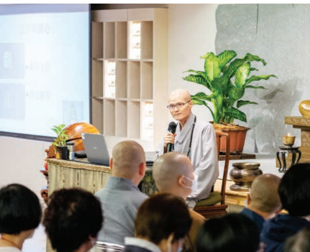
▲全國首場「佛教聯合祈福火化儀式」，法鼓山受邀主法，以莊嚴溫馨的法會，安慰家屬，共同祝禱亡者往生善處。(李東陽攝)

德商西門子 體驗心幸福好放鬆 「心幸福企業體驗營」結合了法鼓山的境教、禪修，並根據企業的需求將心靈環保、心五四及心六倫運用至管理上，課程談人際關係也談理想、談家庭、談職場生活，也談開放心中心幸福的寶山。目前已有十多家企業參與，歡迎各界團體報名體驗。 （文／張曜鐘、圖／賴心萍）