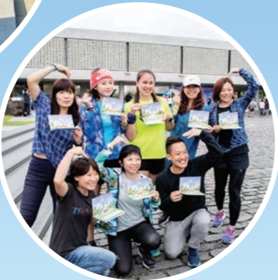
▶水月禪跑結合現代人的日常運動，年輕人呼朋引伴，一起來體驗動中禪。