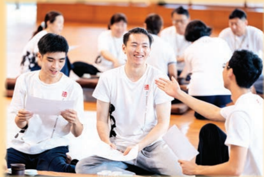
▲法鼓文理學院的茶禪活動，北美青年從公案中，體驗禪法的意趣。

6月28日，40位北美青年來到臺灣，展開一連七天的法鼓山巡禮。從天南寺、農禪寺、齋明寺，到總本山，北美青年有哪些感受和體驗？本期邀請學子們來分享這趟心旅程。