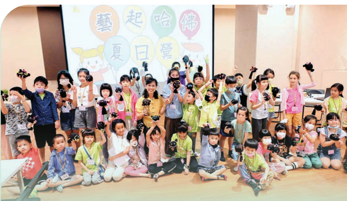
▲護法總會首次開辦「藝起哈佛夏日營」，以雲來別苑為主場，透過視訊連線全臺九個分會。