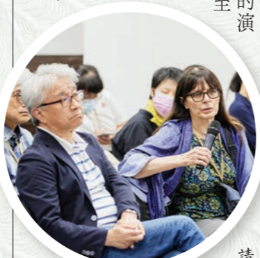
▲來自海外學者把握實體交流機會，向發表人提問。

疫情之後回到實體舉辦的聖嚴思想國際學術研討會，重回學術研究的常態法師，分享會議中的觀察與省思，以及研究聖嚴師父禪修層次演變歷程的自我期許。