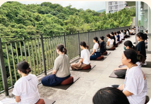
▲文理學院的層層疊疊，學員從大自然中，體會內心的寧靜。

我們總是習以為常地尋求舒適，因此，當既有的觀點和生活方式受到挑戰，很難保持開放的心去擁抱改變。來法鼓山之前，我無法預期會發生什麼，也不確定會得到什麼，然而，這趟旅行對於我的生命，確實產生了積極的影響。清晨的早課、禪坐，還有整個環境的平靜，打破了平日的生活狀態，走出了舒適圈。體驗寺院生活後，明白了許多事。首先是，科技占據了我們的生活，以致於忘了放鬆。我們每天做的一切，都由一方小小的手機會畫面掌控，影響了我們聆聽身體的能力。一天之中，我們有多少次停下來體驗呼吸，放鬆緊繃的肌肉和關節？