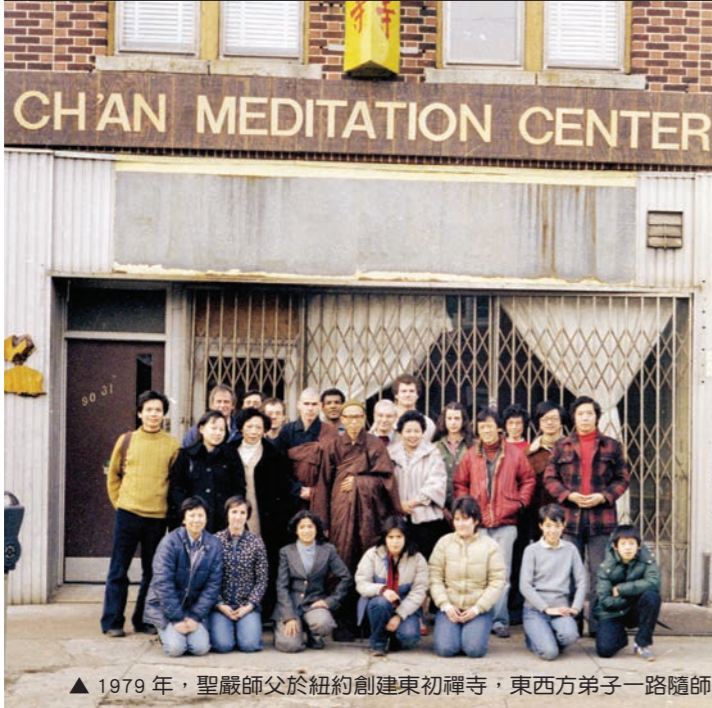
▲ 1979年，聖嚴師父於紐約創建東初禪寺，東西方弟子一路隨師學法護法。