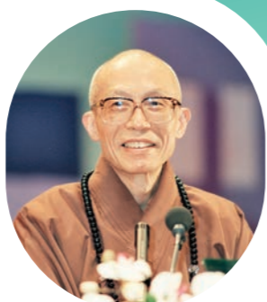
非常感謝諸位菩薩的辛勞，多年來，