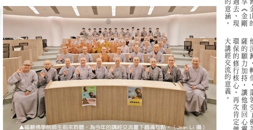
福嚴佛學院師生前來聆聽，為今年的講經交流畫下圓滿句點。

【釋寬融、寬敬／新北報導】法鼓山僧伽大學第十五屆講經交流，四月二十二、二十三兩日，於法鼓文理學院大禮堂展開，這次共有十四位學僧報名，多數為一年級的學僧，雖然不一定以經論為主題，但都是從生活中對自我的觀察，分享自己轉化的「一經一過」，展現了學僧另類講經的活力。活動第二天，福嚴佛學院的師生也特別前來聆聽、交流，共同為今年的講經交流畫下圓滿句點。 僧大副院長常寬法師開場時，以講者的法名與主題，結合偈大的日常生活，巧妙串成一段短文，不僅指出修行生活的一則方向，幽默的開場也讓全場笑開懷。 十四日分享的內容包括《金剛經》、《楞嚴經》、《往生論》等經典，其中，來自舊金山的寬宏菩薩，以英文分享《金剛經》，帶領聽眾反思過去、現在、未來三心不可得的意涵，令人耳目一新。 因同學的老菩薩捨報，二年級的寬瑞法師，寬信菩薩發願透過淨土經典的介紹，迴向老菩薩，讓人感動。「原來死後可以去一個很美的地方！」寬瑞法師用流暢的臺語，如導遊一般，活潑地介紹極樂世界的依報莊嚴，讓聽者心生嚮往。 演維法師「我地向地藏菩薩學習」，自述因為老菩薩生病而開始念地藏菩薩聖號、拜《地藏懺》，聖號自己學習地藏菩薩的心量，去幫助一切有情。寬德法師的「一週