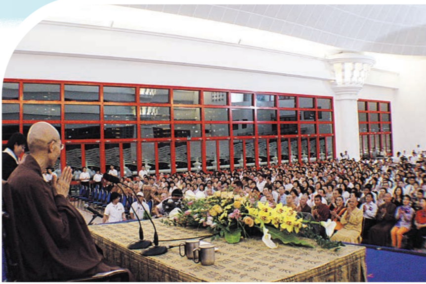
▲2004年4月，師父於新加坡普賢禪寺進行二場弘講，每場都有近七千人到場聆聽。（本刊資料）

佛法最深的目的，是要我們從生死中解脫。生死的解脫有兩種不同狀況，一種是這一生結束以後，再也不要到娑婆世界來投生，從此不再生死。這是一種解脫，也叫作小乘的涅槃。另一種是大乘菩薩的解脫，是從對生