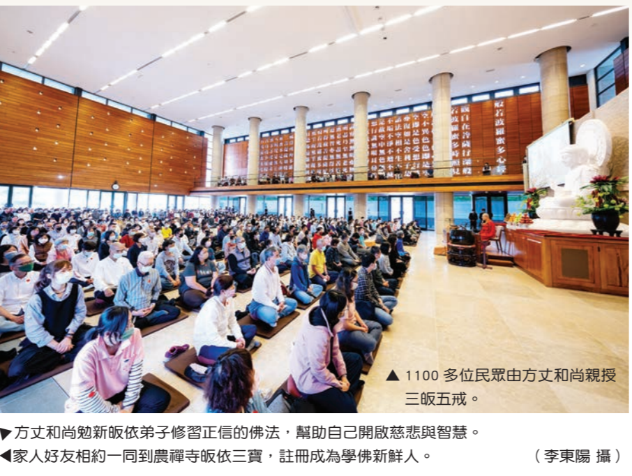
▲ 1100 多位民眾由方丈和尚親授三皈五戒。 ▼ 方丈和尚勉勵新皈依弟子修習正信的佛法，幫助自己開啟慈悲與智慧。 ▲ 家人好友相約一同到農禪寺皈依三寶，註冊成為學佛新鮮人。

【楊仁惠／綜合報導】二〇二三年首場皈依祈福大典，四月十五日於農禪寺盛大舉行。方丈和尚果暉法師為一千一百多位民眾授證皈依，新皈依者的年齡從六到九十五歲，跨越世代一同成為佛陀學生，歡喜共學結法緣，同行菩薩道。 「皈依佛、法、僧，能讓人人生有目標及方向，能帶給我們平安、健康、快樂、幸福。」典禮上，方丈和尚為大眾詳細解說三皈五戒的意義，並說明儀程中懺悔、皈依、發願的用意，勉勵大眾以清淨的身、口、意納受戒體，並發願做自度度人的佛弟子。隨後方丈和尚一句一句地帶領大眾受三皈五戒，殿堂上小菩薩的聲音特別嘹亮，彷彿期待已久，終於滿願。