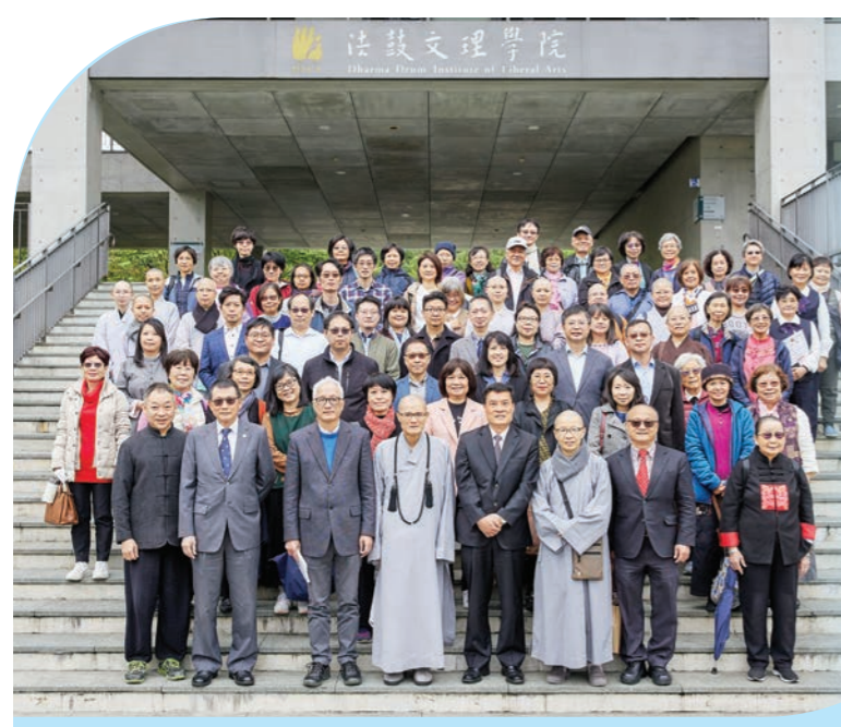
各界貴賓蒞臨文理學院，與全校師生一同迎接十六週年校慶。