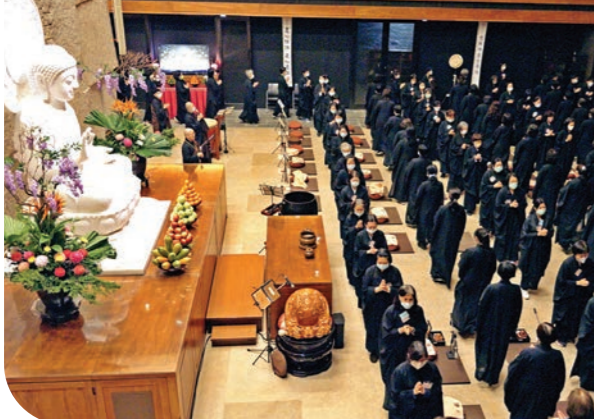
▲農禪寺清明佛七日共修到晚上八點半，都市型態的法會，吸引許多民眾來念佛報恩。