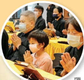
▲小菩薩在花蓮精舍隨著大眾一起恭誦《地藏經》。

【本刊訊】三月二十五日至四月二十三日，全球各分支道場，護法會先後舉辦清明報恩共修，無論現場參加，還是線上參與，海內外各地信眾把握難得的因緣，投入拜懺、念佛、誦《地藏經》等共修；各地法會的功德堂，共匯集四十多萬筆雲端祈禱，傳遞了為現世父母和親友祈福的心意，以及超薦歷代祖先、迴向一切眾生的祝願，體現感恩報恩、平等慈悲之心。 四月二至八日，農禪寺、寶雲寺舉辦為期七天的精進共修。為方便更多人參與念佛和拜懺，農禪寺清明佛七首度開放不過夜、不需事先報名，早中晚三個時段皆可隨喜參加的方式，第一天一早，寺內各佛堂即坐滿了共修大眾。而寶雲寺梁皇寶懺法會除了現場參與，更有宜蘭分院、齊明別苑，以及彰化、員林、南投等分會的信眾，就近在道場內視訊連線，同步禮拜《梁皇寶懺》，共學慈悲道場懺法。國內的中華佛教文化館、安和分院、臺南分院、紫雲寺、信行寺、花蓮精舍等，以及海外的溫哥華、洛杉磯、馬來西亞等道場，