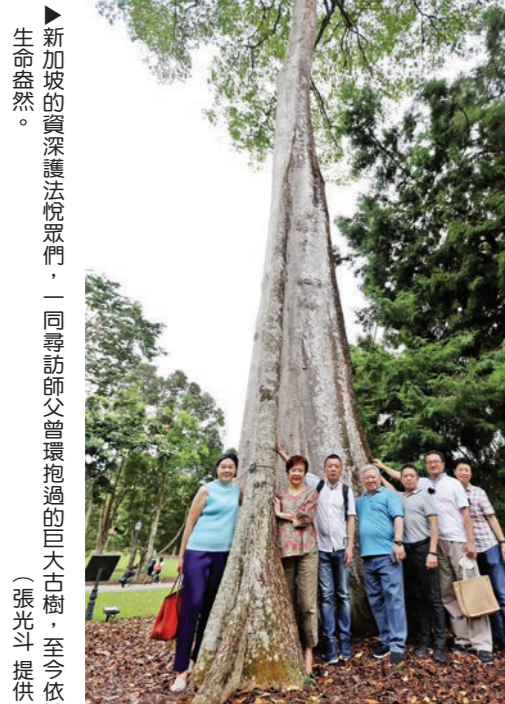
▲新加坡的資深護法們，一同尋訪師父環抱過的巨大古樹，至今依然生命盎然。