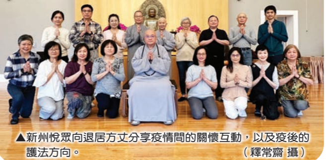
▲新州悅眾向退居方丈分享疫情間的關懷互動，以及疫後的護法方向。

十一日上午，在北美護法會輔導法師常華法師、東初禪寺常監法師陪同下，退居方丈先到分會與悅眾法喜團交流，除了報告會務，大眾也把握因緣請法、分享自己的學佛成長，退居方丈一一了解、回應，現場互動熱絡、溫馨。