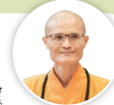
▲編輯《法鼓》雜誌的過程，也是實踐佛法的生命之旅。

過去常看報紙，不免會因許多負面內容而影響心情，閱讀《法鼓》雜誌總能帶給我一股安定的力量，尤其這些年世界遭逢疫情，《法鼓》持續傳遞善法，安定人心，打開學佛的視野。