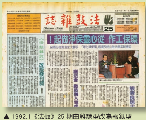
▲1992.1《法鼓》25期由雜誌型改為報紙型

身為編輯的一員，看著數位化、AI智慧浪潮的興起，每月還能編出一份泛著油墨香、並且如期送到讀者手中的紙本報刊，何其榮幸！ 每一期，透過海內外各地的來稿，快速掌握法鼓山弘化的脈動，也從心得分享中同感同行菩薩道的溫暖。未來無論媒體的型態如何轉變，期許《法鼓》雜誌都能承擔傳遞、弘揚法鼓山理念的使命，陪伴讀者將心靈環保的觀念、方法及活動，在生活中落實，讓生命點滴改變。