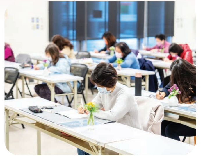
▲在農禪寺的清淨環境中，民眾以虔誠專注的心，一筆一畫鈔寫經文。

2019年，農禪寺開始推廣「靜心鈔經」活動，融入禪修體驗的鈔經共修，三年多來，參與體驗的民眾愈寫愈法喜。如何於一筆一畫間，寫出安定喜悅？本期帶您深入「鈔經@禪」的鍊心過程。