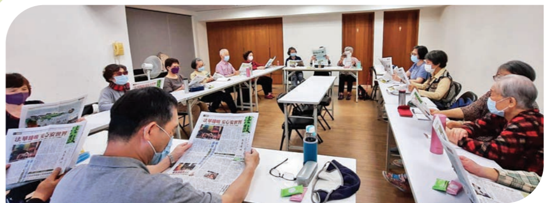
▲自在讀書會每個月討論《法鼓》，協助同學們了解法鼓山。

認「識」《法鼓》雜誌是因為母親。以前家裡放電話的茶几上，總放著當月或過期的雜誌，她期許家人能翻閱、能學佛，但對時機未到的人而言，它是隱形的。直到煩惱累積到終於拿起這份自稱「雜誌」的報紙，才了解母親全心投入的這個佛教團體到底在做什麼。