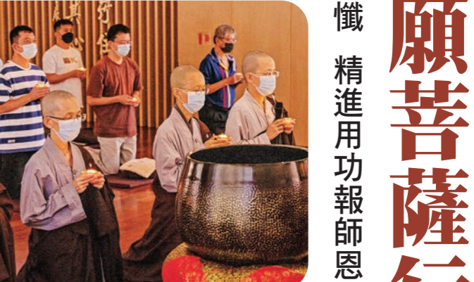
▲馬來西亞道場的傳燈法會，回歸個人日常用功，鼓勵大眾「一人一恆課，行願報師恩」。

「報答師恩的最好方式是回歸到個人日常的用功，將佛法實踐在生活中的。」元月二十九日，馬來西亞道場別開生面，以「一人一恆課，行願報師恩」為主軸，邀請信眾以個人日常恆課，如禪坐、持咒、念佛、經行等方式來憶念師恩，共有近六十位信眾簡樸安定，卻是最直接地與師父相應、與法相契。 泰國護法會則於二月四日舉行大悲懺法會，以觀音法門為傳燈法會揭開序幕。兩場法會皆由常持法師主持，帶領數十位信眾收攝身心，藉由禮拜、觀照自心，學習菩薩慈悲與智慧，共同發起大菩提心，發願行菩薩道，以報答師恩。