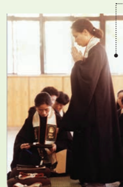
法鼓山在臺灣首傳在家菩薩戒