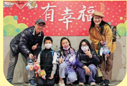
▲民眾到農禪寺做燈籠、猜燈謎、提燈籠，闔家幸福。

「楊仁惠、林秀敏／綜合報導」二月三日晚間，下班後的人潮一波波湧入農禪寺，不少民眾闖家前來，參加「農禪寺元宵夜」活動，體驗結合親子手作燈籠、猜燈謎、提燈遊行、吃元宵、祈福法會的漢傳佛教節慶文化。 「答對了！」此起彼落的掌聲、笑聲，來自猜燈謎會場。寫在紅色紙條上的燈謎，掛滿會場。謎題有趣又多元，不少民眾不斷挑戰，懷抱滿滿的獎品。手作燈籠組裝好後，可換一份象徵元宵的麻糬，方便衛生又美味。闔家大小開心地提著燈籠，穿梭在金剛經牆及各廊道的紅色大掛燈之間，輝映相襯，大小燈光的溫暖，讓農禪寺元宵之夜別有風味。 當晚天氣寒冷，但熱鬧的猜燈謎、提燈遊行，讓農禪寺洋溢著溫馨又幸福的氛圍。近八點時，大眾順序進入大殿，隨著監香法師帶領，體驗呼吸、放鬆身心、虔敬地恭誦《觀世音菩薩普門品》及觀音聖號，讓身心安定，也與觀音菩薩相應。 「大家手上的燈籠，已經等你們指出了，燈籠上的一培福有願功德分享十方。」