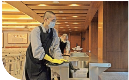
▲出坡是僧眾的日常作務，學員在除塵掃垢的過程中，體驗勤勞健康最好。

2/10【創辦人的悲願】眾生無邊 我願無窮 欲望和願望有何不同？一般的許願和悲願一個一個問題來問，抽絲剝繭，只為釐清何謂悲願？ 欲望因匱乏和缺陷而來，對自己的處境不滿而努力，在未獲得滿足之前，一切都是痛苦的。然而，所有的滿足只不過是另一個欲望的新起點。而我們一般的許願，因可以被滿足而有限，又只圍繞著自己，很快又會匱乏。 聖嚴師父說：「虛空有盡，我願無窮。」悲願為何能無限？從師父所說的開山的意義可知：「開山，是要開每個人心中的山……因此這工作，是永遠做不完的，只要每天有新的生命出生，這個人心中的山還是需要開。因此我們這座山是無盡藏……」難怪師父的願力無窮，原來是眾生無邊、煩惱無盡。 有人問聖嚴師父：人間淨土會實現嗎？師父說：「不會！——那麼乾脆，那麼直截，那為何要建設人間淨土呢？」 重點不在於結果，而是過程，我們對未來的想像不一定能成真，但過程要有實踐的著力點，「行願」無盡才是重點。既然無盡，那如何完成呢？「我今生做不完的事，願在未來無量生中繼續推動，我個人無法完成的事，勸請大家來共同推動。」 原來大家來推動，原來不是一個人好就好，大家一起好，才是好，大家一起來做，人間淨土就可以實踐了。