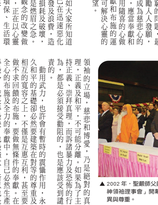
▲2002年，聖嚴師父與各國宗教領袖於「世界宗教暨精神領袖理事會」開幕典禮前祈禱，體現不同宗教的差異與尊重。(本刊資料)

2023 泰國 首屆世界宗教暨精神領袖理事會在曼谷召開，聖嚴師父與來自世界各宗教的領袖，齊心為世界和平奉獻智慧。(本刊資料)