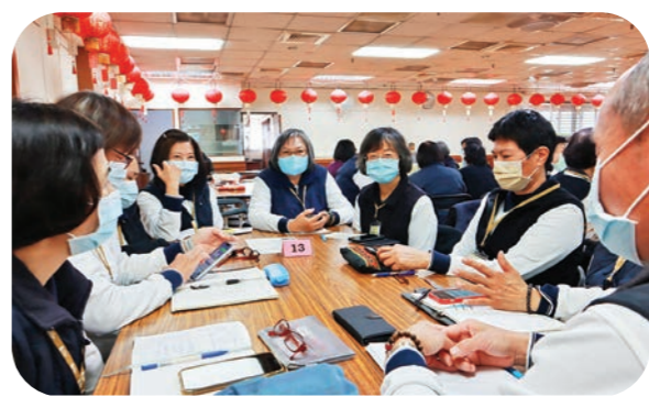
▲透過手機操作、實體討論進行，悅眾團隊探討如何提高團隊執行效能。