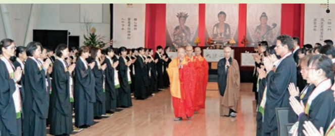
菩薩戒弘傳至加拿大