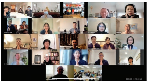
▲無論實體上課，還是線上學習，不同國度的學員，用多種語言參與討論。

聯合佛學班還包括倫敦、共修處十四名學員，分別來自英國、芬蘭、德國、義大利、以色列等國家。課程中的討論，分為國語、廣東話，以及於Zoom上課的英語組，三種語言分別進行；課後作業運用Google Classroom上傳繳交。因應不同語系的學員，這次佛學班動員了多倫多、溫哥華兩地翻譯組九名義工，一同承擔三年的英文翻譯任務。