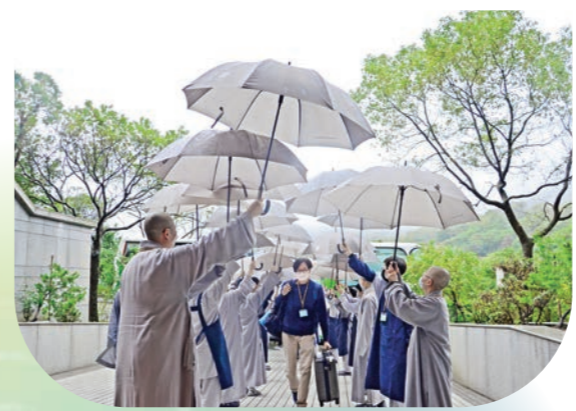
▲自覺營到營天下雨，僧大師生合力打起雨傘，也是引度學員的菩薩橋。

悉達多太子，越過迦毘羅衛王宮的迷惑和束縛而逾城出家；因為他發現苦難的錦衣華服，沒辦法接觸到世間的苦難，停留在舒適的地方，更將遠離真理與智慧。唯有離開舒適圈，才能衝擊與淬鍊出世的真理與離苦的智慧。最重要的是這座城池的一切，並非自己的本性，所以出外了。 如果沒有重逢，分離也就沒了意義。所以出家不是空手而歸的道路，而是捨得多少，就有多少，大捨而大得，當擁有一切時，相對的束縛緊接而至，當一無所有時，反而可以對整個世界；捨下貪欲，得到知足；捨下瞋恚，得到平靜；捨下愚癡，得到智慧…… 出家為僧，豈是小事！離開安逸、離開溫飽、離開名利、離開我執……為與自己的本性重逢，為解脫生死的苦痛，為掙脫煩惱的束縛，為承續佛陀的智慧，為解救無盡的眾生，這就是出家的精神。是離開，也是重逢！