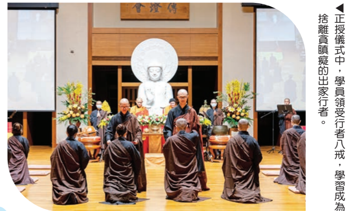
▲正授儀式中，學員領受行者八戒，學習成為捨離貪瞋癡的出家行者。

農夫播種前，會先清除田裡的石塊和垃圾，還要撥鬆田地的泥土，土鬆了，灌溉下的水才能吸收。硬梆梆的土，就算播下的種子才能順利萌發。 正授前的拜懺，就像農夫播種前的鬆土與除穢，也像廚師炒菜前，洗淨鍋子一樣。以清淨勤能的身心，準備納受戒體。往昔所造諸惡業，皆由無始貪瞋癡；從身語意之所生，今對佛前求懺悔。 懺悔是願意承擔因果，懺悔是放下過去糾結；願意承擔，便可放鬆；願意放下，雜質少了，心更清淨，便能更無畏地前進。先把自己清淨歸零，納受的戒體，就如種子入沃土，遇水則發，萌芽與結果就只是水到渠成的事而已！懺悔，成就了長養僧格的沃土。