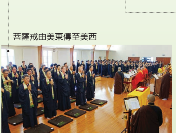
菩薩戒由美東傳至美西