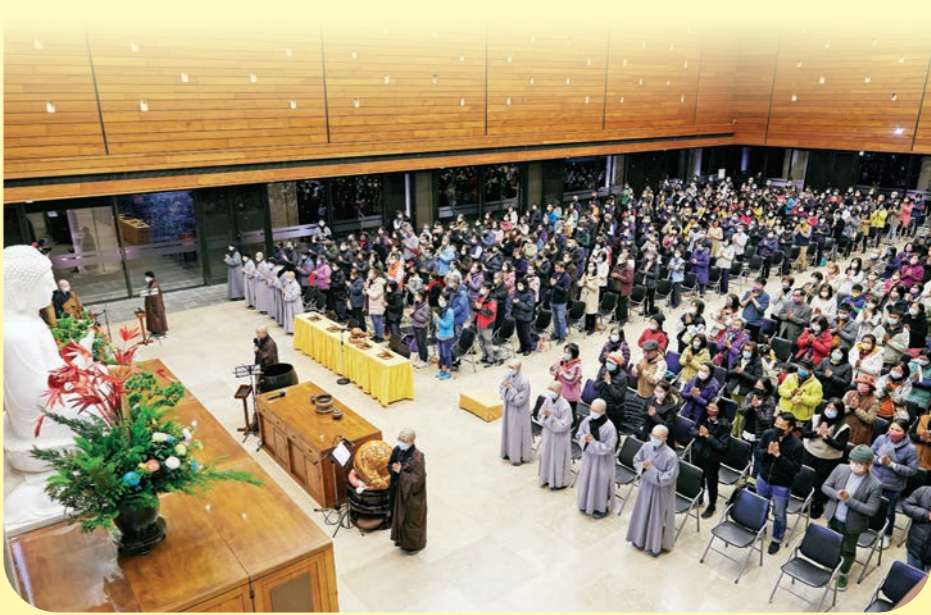
▲民眾參與農禪寺元宵祈福法會，將修福修慧的功德迴向十方。

「楊仁惠、林秀敏／綜合報導」二月三日晚間，下班後的人潮一波波湧入農禪寺，不少民眾闖家前來，參加「農禪寺元宵夜」活動，體驗結合親子手作燈籠、猜燈謎、提燈遊行、吃元宵、祈福法會的漢傳佛教節慶文化。 「答對了！」此起彼落的掌聲、笑聲，來自猜燈謎會場。寫在紅色紙條上的燈謎，掛滿會場。謎題有趣又多元，不少民眾不斷挑戰，懷抱滿滿的獎品。手作燈籠組裝好後，可換一份象徵元宵的麻糬，方便衛生又美味。闔家大小開心地提著燈籠，穿梭在金剛經牆及各廊道的紅色大掛燈之間，輝映相襯，大小燈光的溫暖，讓農禪寺元宵之夜別有風味。 當晚天氣寒冷，但熱鬧的猜燈謎、提燈遊行，讓農禪寺洋溢著溫馨又幸福的氛圍。近八點時，大眾順序進入大殿，隨著監香法師帶領，體驗呼吸、放鬆身心、虔敬地恭誦《觀世音菩薩普門品》及觀音聖號，讓身心安定，也與觀音菩薩相應。 「大家手上的燈籠，已經等你們指出了，燈籠上的一培福有願功德分享十方。」