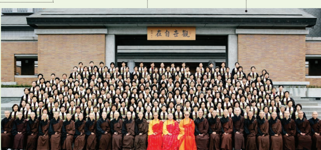
菩薩戒首度在法鼓山園區傳戒