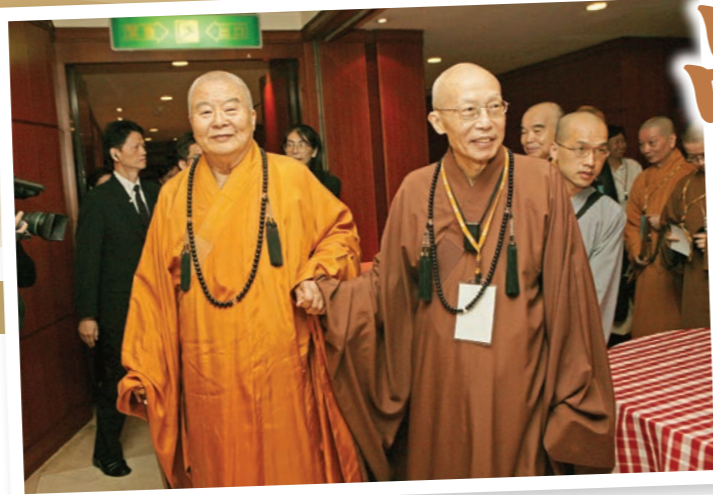
二〇〇五年法鼓山落成開山，星雲長老親自出席開山相關活動，師父歡喜相迎。