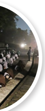
▲濃霧細雨中，學員三步一拜，禮敬佛陀、禮敬大地，一起航向解脫之路。

來自馬來西亞、新加坡、越南、加拿大、大陸及臺灣等地八十六位青年，二月五至十二日集聚法鼓山上，一起長養「僧」命，體驗出家生活。透過僧大教務長常啟法師隨筆所記，與您分享生命自覺營的「一心」領會。 ◎文／釋常啟