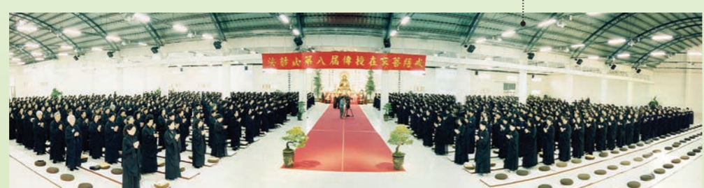
首度舉辦千人菩薩戒會