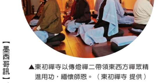
▲東初禪寺以傳燈禪二帶領東方禪眾精進用功，緬懷師恩。

【本刊訊】創辦入聖嚴師父教澤，邁入第十四個年頭，您想念師父嗎？美國、加拿大、馬來西亞、泰國、香港等地的信眾，透過禪修、念佛、拜懺、傳燈等方式，共同緬懷師恩，發願自覺覺他，點亮自己和他人自性中本具慈悲與智慧的光明心燈。 元月二十八日，紐約東初禪寺率先舉辦「傳燈禪二」，佛州塔城分會則於二月三至五日，舉辦實體精進共修，緬懷聖嚴師父的教澤，並重新提起初發心，菩提道上再向前。 際遇三年，加拿大溫哥華道場、美國舊金山道場、西雅圖分會，於二月四日舉辦實體傳燈法會，這也是西雅圖分會在新會址的首辦，當天適逢溫哥華道場和西雅圖分會聖嚴書院佛學班開課，信眾的參與特別踴躍，新學員和資深學員齊聚一堂念佛、傳燈。當夜幕低垂，一盞盞燈點亮了道場，也象徵護持佛法的願心相續不斷，別具傳承意義。 西雅圖分會法會結束後，特別邀請曾親炙聖嚴師父的悅親法師代為開示，而資深信眾的悅親法師代為開示，以「一人一恆課，行願報師恩」為主軸，邀請信眾以個人日常恆課，如禪坐、持咒、念佛、經行等方式來憶念師恩，共有近六十位信眾簡樸安定，卻是最直接地與師父相應、與法相契。