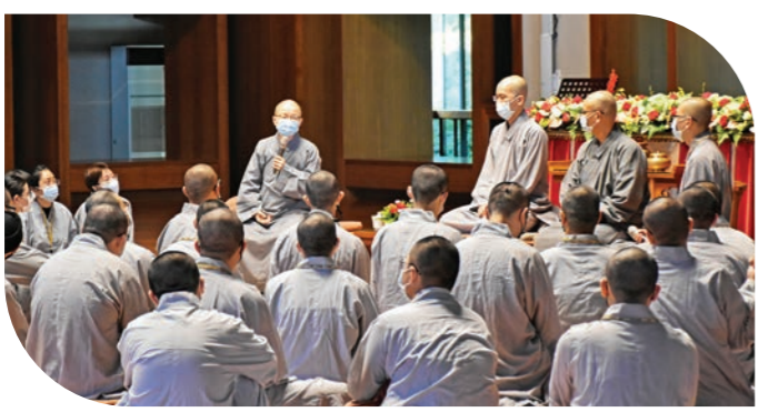
▲代表「果、常、演、寬」四個世代的法師，分享不同因緣的出家歷程。