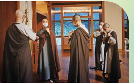
▲穿海青與搭襪衣是出家人調整身、口、意習慣，養成威儀的第一步。